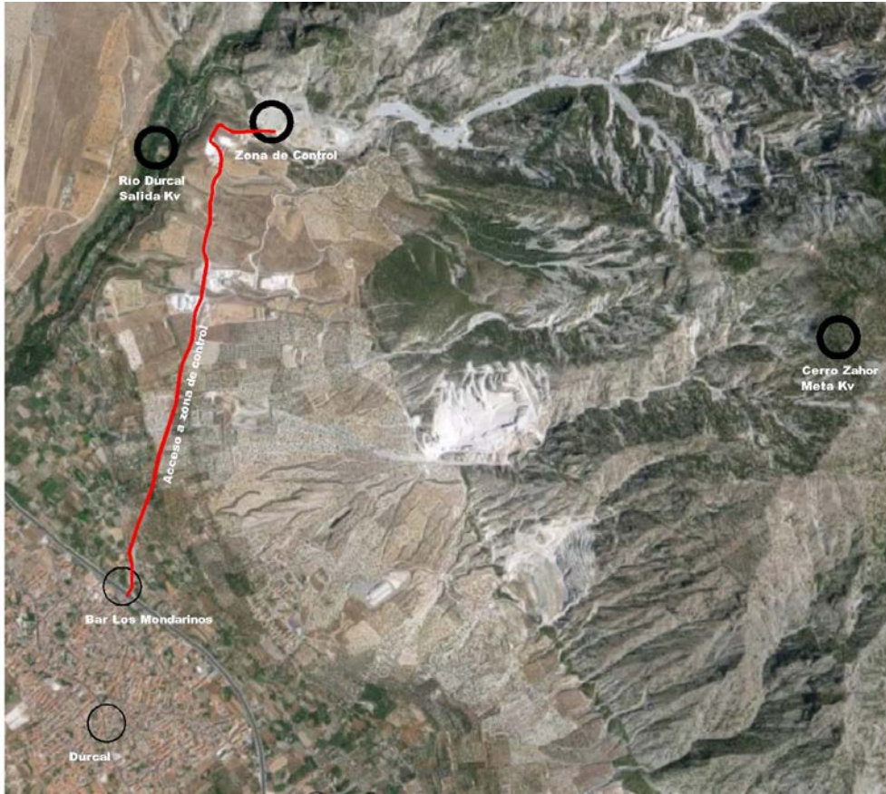
Detalle de zona de control