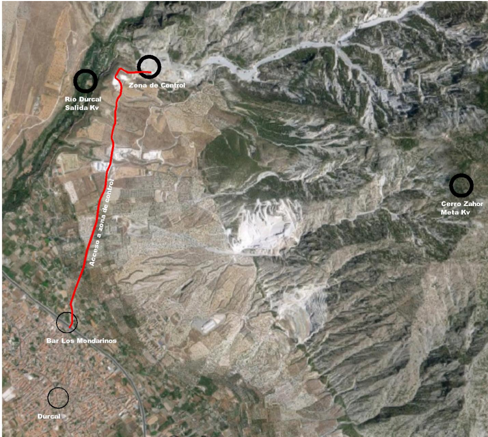
Detalle de zona de control